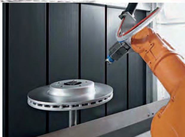
Buse fine : les disques de frein partiellement peints ne font l'objet d'aucun masquage.