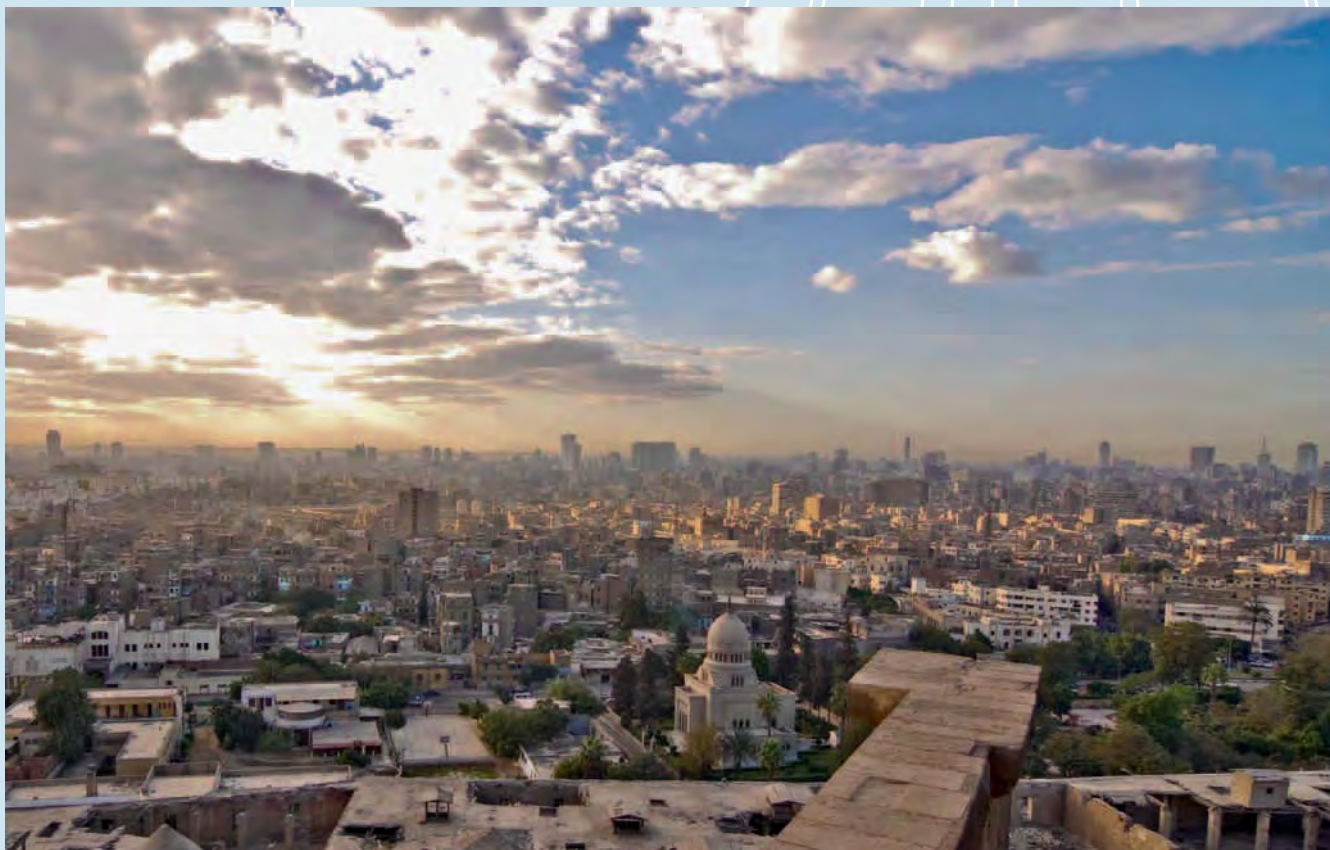
Des équipements de process Festo et BAMAG GmbH assurent l'alimentation en eau potable au Caire.