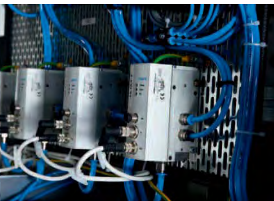
Excellentes performances : le distributeur proportionnel pour servopneumatique VPWP