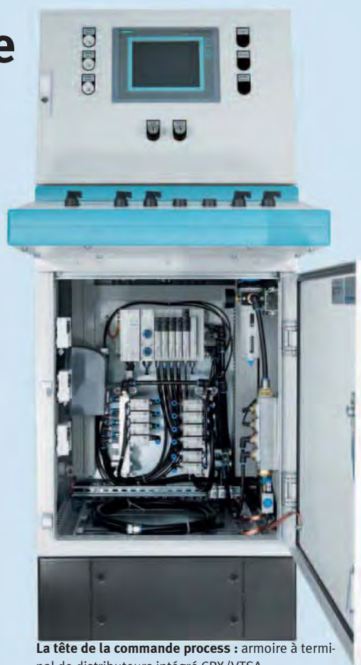
La tête de la commande process : armoire à terminal de distributeurs intégré CPX/VTSA.

Pour l'application des bords du Nil, Festo fait appel à des composants éprouvés. Des vérins linéaires DLP à fonction d'ouverture/fermeture commandent automatiquement le passage de l'eau brute à l'eau de rinçage. Débits d'air, eau de nettoyage et eau potable sont régulés par trois vannes automatisées équipées de vérins oscillants DFPB/DAPS et de boîtiers de capteurs SRAP. L'armoire abrite le terminal de distributeurs CPX/VTSA, un API et l'afficheur FED.