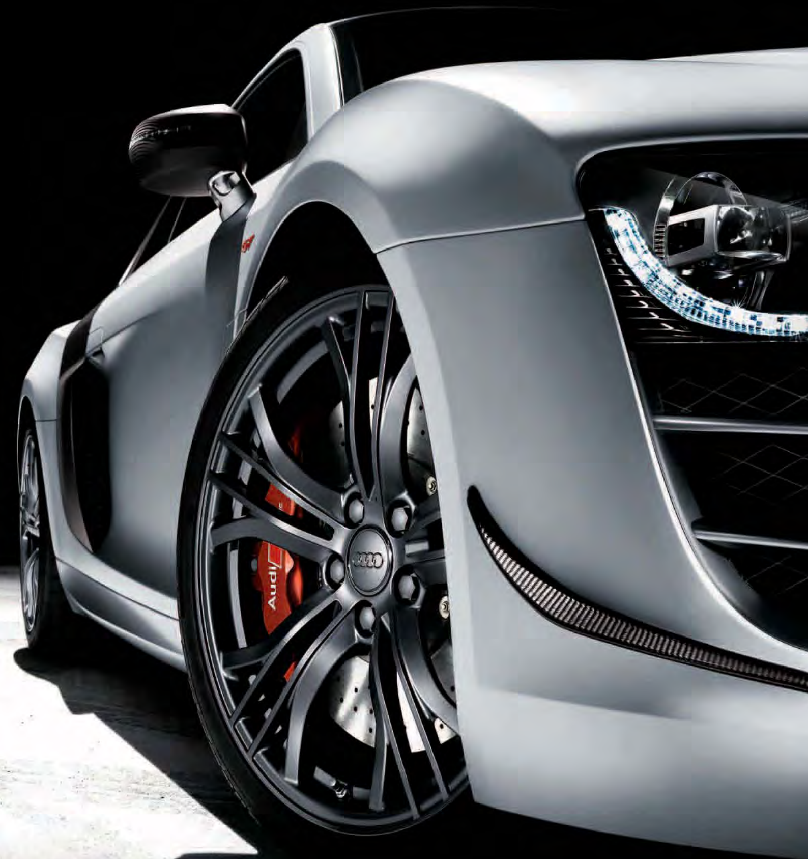
Attraction : disque de frein de l'Audi R8 GT.