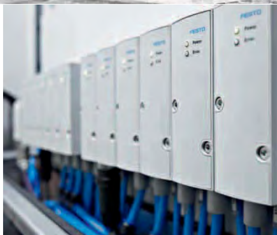
À la puissance 12 : une douzaine de régulateurs proportionnels Festo VPPM régulent avec précision la pression de pulvérisation.

La parfaite exécution des programmes informatiques par la pneumatique est au cœur du processus de mise en peinture. À l'arrivée des produits, un palpeur laser identifie le type de disque et transmet l'information à l'API. La commande de l'installation achemine alors les données contenant les paramètres de réglage de la pression de pulvérisation aux régulateurs proportionnels VPPM. Leur régulation en cascade, à commande multi-capteurs intégrée, règle ainsi de manière optimale l'air de pulvérisation, la largeur du jet et l'air de commande, réduisant de ce fait l'« overspray ». Ce terme désigne dans les applications de pulvérisation la quantité de produit s'échappant →