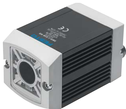
System wizyjny SBOI-Q ze zintegrowanym obiektywem i oświetlaczem.

System wizyjny umożliwia uzyskanie gwarantowanych, niezawodnych wyników badań w bardzo szerokim zakresie zastosowań, szczególnie w mechatronicznych układach wieloosiowych. SBOx-Q określa położenie oraz kąt obrotu przedmiotów w celu precyzyjnego pozycjonowania napędu. Ma również możliwość identyfikacji typu części oraz sortowania. Można zapisać do 16 różnych typów części w danym programie.