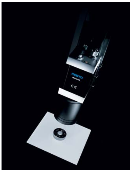
Inteligentny kompaktowy system wizyjny SBOx-Q zmienia spojrzenie na elastyczność w procesie zapewniania jakości.

Systemy wizyjne (Machine Vision) są siłą napędową innowacji wprowadzanych w automatyzacji procesów produkcyjnych i montażowych. Nie ma w tym nic zaskakującego, ponieważ inteligentne systemy wizyjne, takie jak SBOx-Q, istotnie skracają przerwy w pracy oraz poprawiają wydajność i elastyczność układów automatyki.