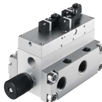
En option : Réglage du débit lors du soufflage préalable (par paliers)