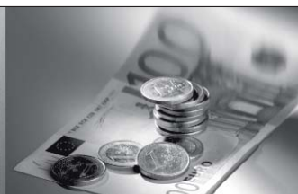
Værdi for pengene!