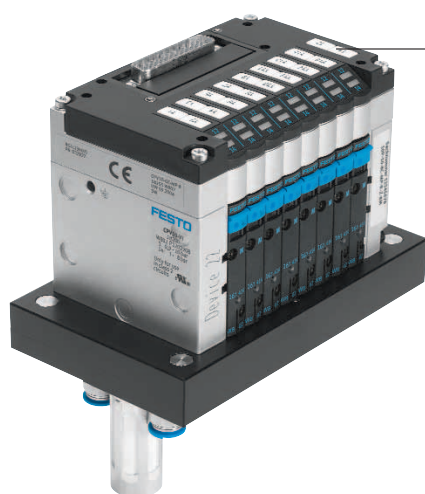
Rótulo de la bobina