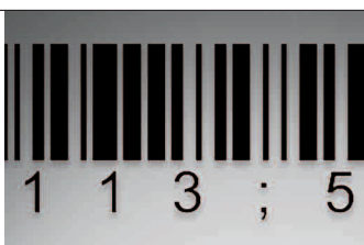
Sin posibilidad de error

Hemos adaptado nuestro desarrollo a sus necesidades personales: gracias a la disponibilidad de diversos tamaños de etiquetas, formatos convencionales de códigos de barras y texto en varios idiomas, nuestras etiquetas ofrecen una aplicación prácticamente universal. Usted mismo decide qué tipo de información deben contener sus etiquetas.