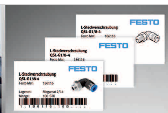
Con su propio diseño