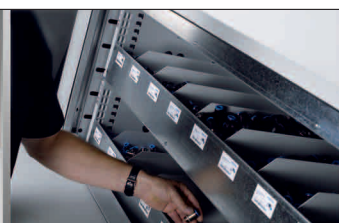
Sin necesidad de búsqueda