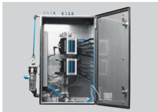
Armarios de distribución clean design y habituales en la industria