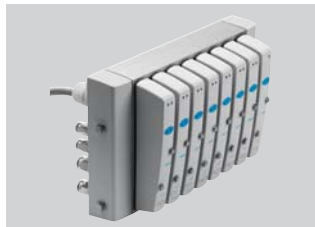
Válvulas estándar/normalizadas, auxiliares, terminales de válvulas