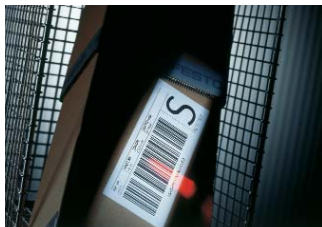
Supply Chain Services