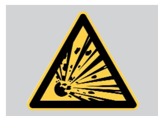
Entornos con riesgo de explosión