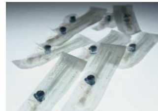
Entornos de producción esterilizados