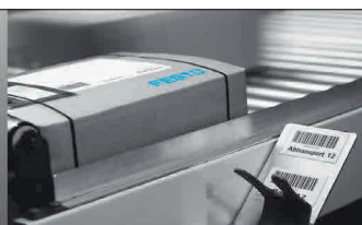
Seguimiento de pedidos