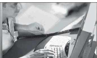
Pedido de productos