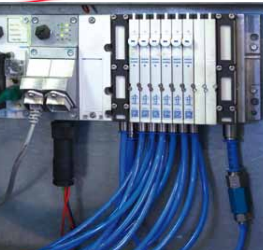
Die Steuerung des Handlings und der zugehörigen Peripherie erfolgt über eine CPX CEC-C1. Der CPX-M-FB34 (im Bild Modul 2) ermöglicht den Datenaustausch zum übergeordneten Prozessleitsystem. Die Ansteuerung der Magnetventile erfolgt ebenfalls über die Einheit.