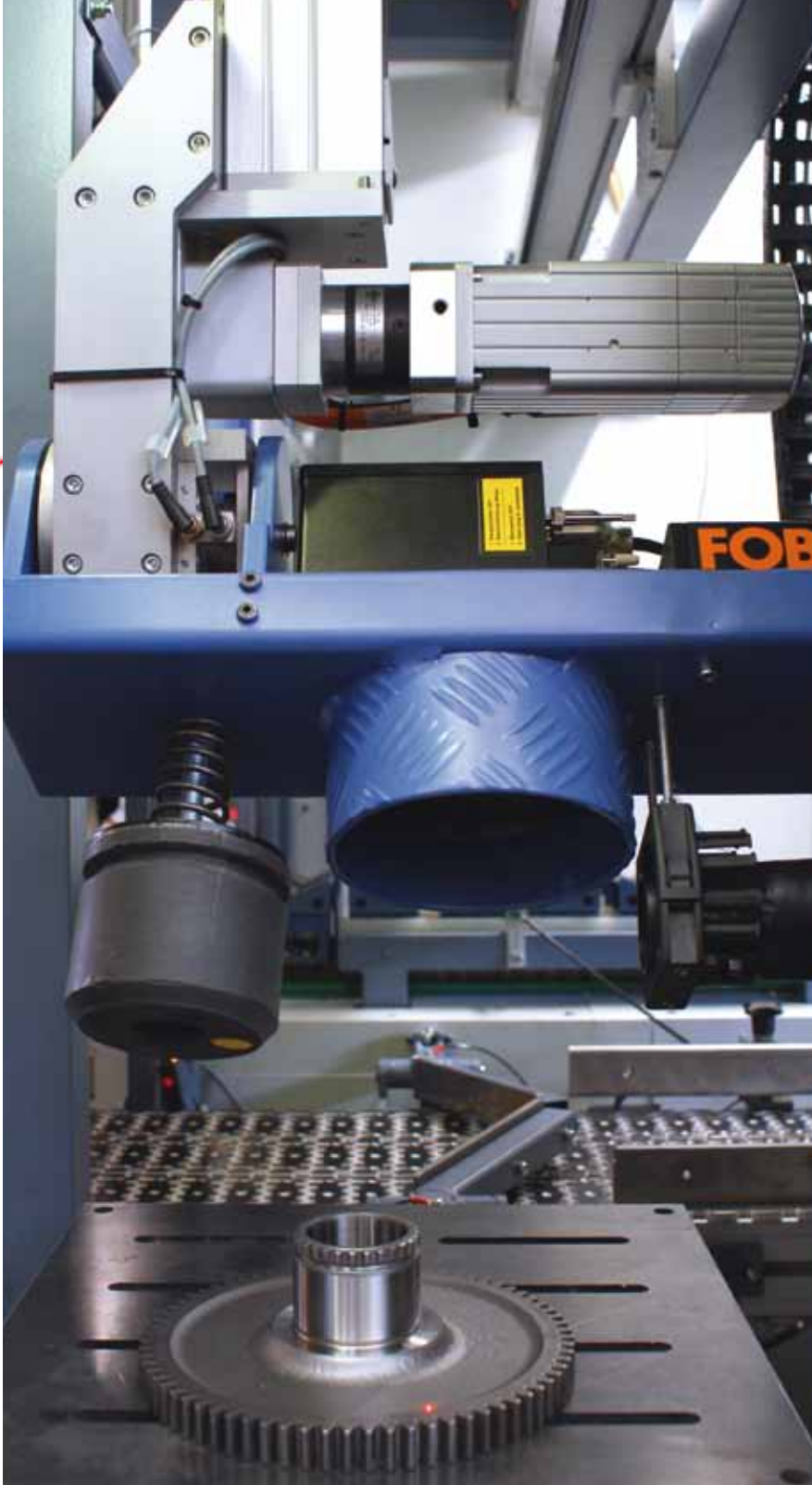
Beschriftung im Getriebebau