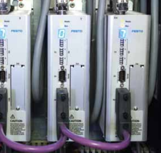
Der Motorcontroller CMMS verbindet die drei Achsen über CAN-Bus mit der Steuerung CPX-CEC-C1.