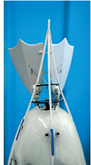
Heckpartie als 3D Fin Ray® Struktur