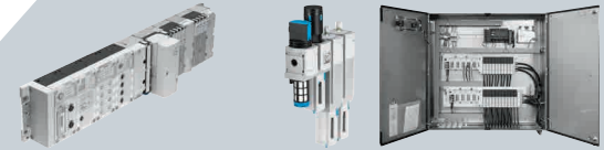
Steuerung und Regelung