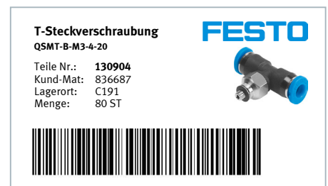
Bar-Code (Festo Label Designer)