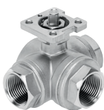
Válvula de bola de 3 vías VZBE