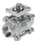
Válvula de bola de 2 vías VZBE