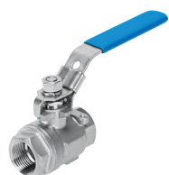
Válvula de bola VZBE, manual