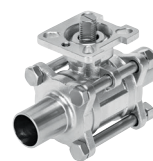
Válvula de bola VZBD, con extremos soldados