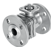
Válvula de bola VZBF