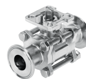
Válvulas de bola VZBD, con manguito de sujeción largos