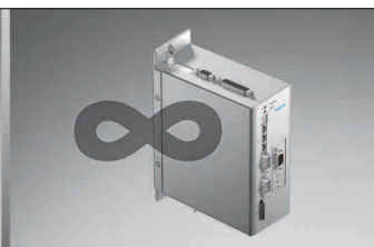
Closed Loop inkl.