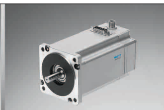
Price follows function